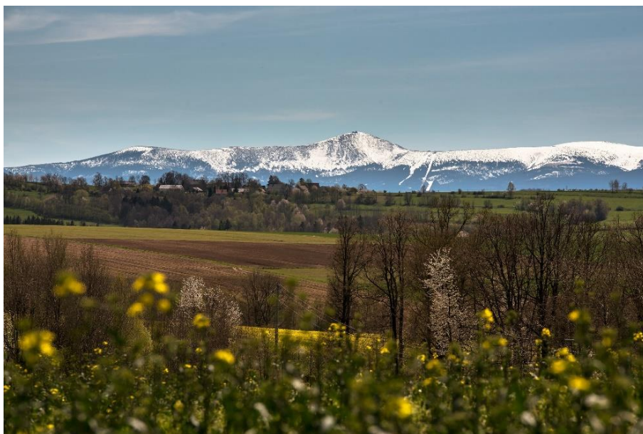
Śnieżka widziana z Gór Kaczawskich (okolice Bystrzycy). Śnieżka

Kraków 18°C Kielce 18°C Rzeszów 19°C Zakopane 15°C