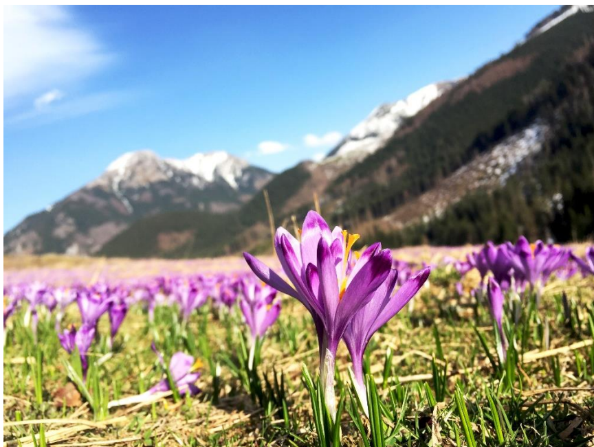
Krokusy w Dolinie Chochołowskiej.

Kraków 16°C Kielce 17°C Rzeszów 19°C Zakopane 12°C