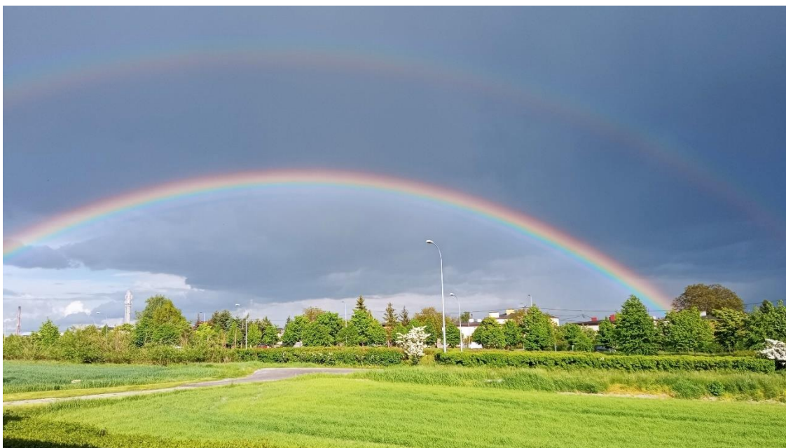
Podwójna tęcza nad Kaliszem, 23.05.2021 r.