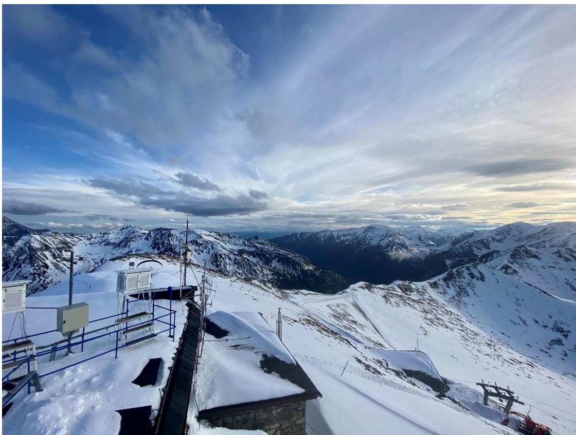
Wysokogórskie Obserwatorium Meteorologiczne IMGW-PIB na Kasprowym Wierchu, 21.05.2021 r.