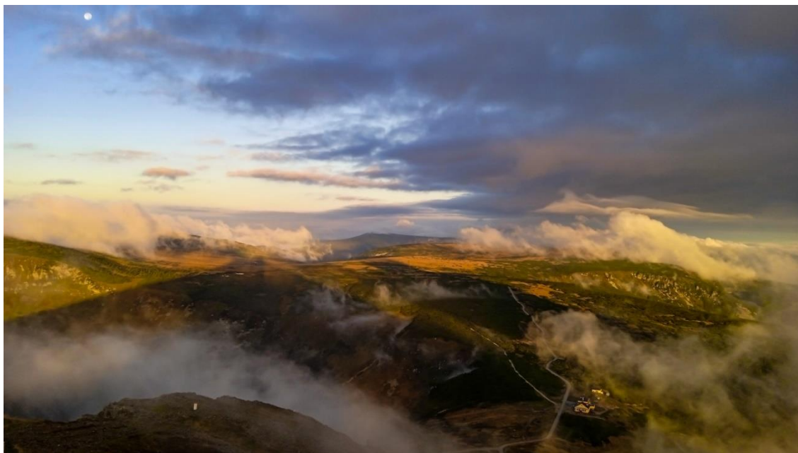
Wschód Słońca na Śnieżce, 12.09.2022 r.

W poniedziałek na przeważającym obszarze kraju dość pogodnie. Na Pomorzu i na Dolnym Śląsku okresami wzrost zachmurzenie do dużego i miejscami przelotny deszcz. Najwięcej chmur na wschodzie i tam okresami opady deszczu lub mżawki. Temperatura maksymalna od 17°C do 21°C, chłodniej na wschodzie i w obszarach podgórszych Karpat – od 11°C do 15°C. Wiatr słaby i umiarkowany, północno-zachodni i północny.