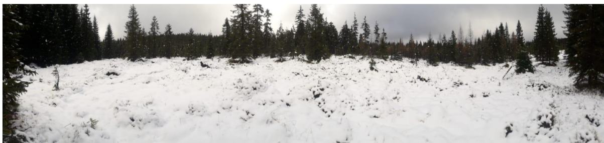
Torfowiska Izerskie.

Najchłodniej będzie na Suwalszczyźnie i w rejonach podgórskich Karpat, gdzie temperatura nocą obniży się do -7^{\circ}\text{C} , a w ciągu dnia wzrośnie do zaledwie 1^{\circ}\text{C} . Najcieplej będzie na południowym zachodzie, gdzie w poniedziałek i wtorek, w południe, temperatura powietrza osiągnie 7^{\circ}\text{C} . Drogi i chodniki okresami będą śliskie z powodu oblodzenia mokrej nawierzchni przy spadku temperatury poniżej 0^{\circ}\text{C} lub też za sprawą marznącego deszczu i mżawki powodujących gołoledź.