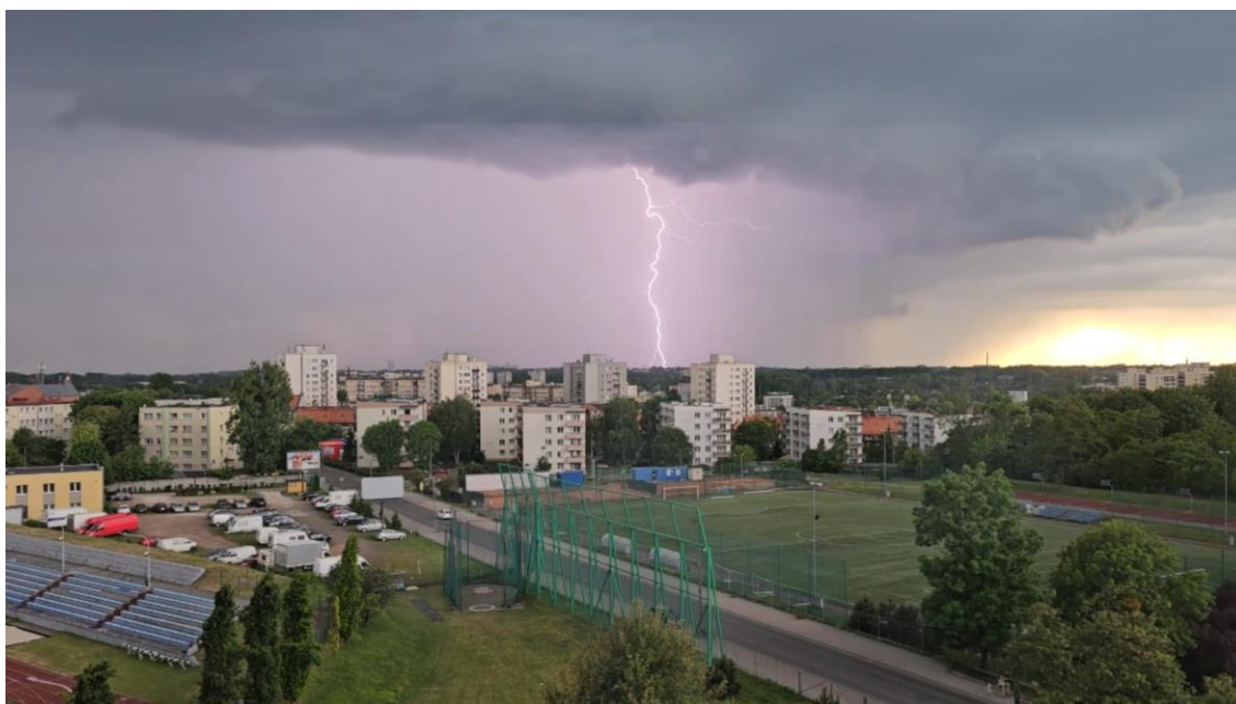
Uwaga na burze! Burza na Śląsku, 19.05.2024 r.

W poniedziałek zachmurzenie umiarkowane, okresami duże. Po południu przelotne opady deszczu, miejscami burze, które lokalnie, zwłaszcza na południowym wschodzie, mogą być gwałtowne. Temperatura maksymalna od 21°C do 26°C; chłodniej nad morzem oraz w rejonach podgórskich, od 18°C do 22°C. Wiatr słaby i umiarkowany, południowo-wschodni i południowy, na północy miejscami wschodni. W czasie burz w porywach do 70 km/h. W Sudetach porywy do 70 km/h.