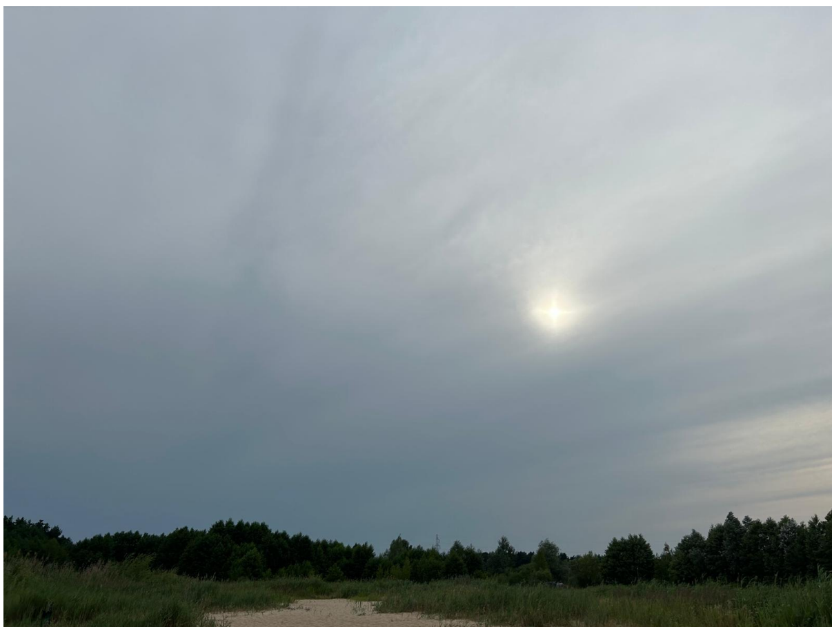
Pochmurne Mazowsze, 27.06.2024 r.

Weekend będzie w wielu miejscach upalny i burzowy za sprawą przemieszczających się z zachodu na wschód frontów atmosferycznych i napływu gorącej, zwrotnikowej masy powietrza. W piątek burze wystąpią w całym kraju, w sobotę na południu i wschodzie, a w niedzielę głównie na zachodzie. Opady deszczu mogą być miejscami nawalne, powodując zalania i lokalne podtopienia. Porywy wiatru w burzach w piątek i niedzielę mogą sięgać do 80 km/h, na zachodzie do 90-100 km/h.