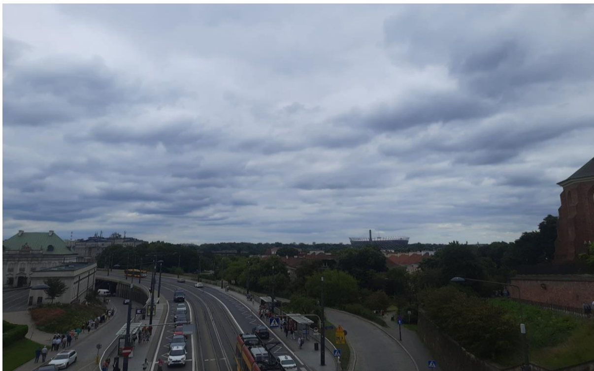
Pochmurna Warszawa, 23.06.2024 r.

Kraków: 28°C Kielce: 27°C Rzeszów: 28°C Zakopane: 25°C