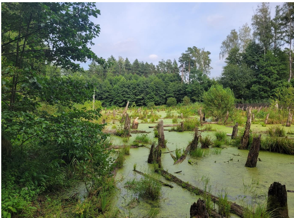
Arboretum Wirty, sierpień 2024; fot. Agnieszka Harasimowicz | IMGW-PIB

Niedziela może upłynąć pod znakiem chłodniejszej aury, choć w wielu miejscach słonecznej. Opady deszczu są spodziewane tylko na południowym wschodzie kraju. Nieco chłodniej nad morzem, na Podkarpaciu i wschodzie Lubelszczyzny, od 17°C do 21°C, na pozostałym obszarze od 22°C do 26°C. Wiatr słaby i umiarkowany, przeważnie północny.