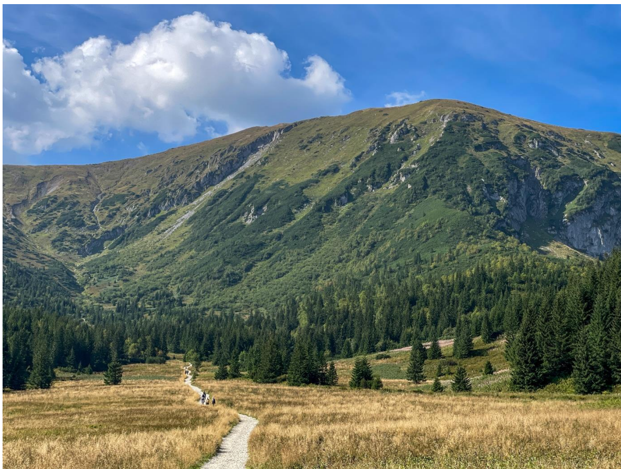
Hala Gąsienicowa, wrzesień 2024 r.

W weekend słonecznie i upalnie, ale w niedzielę od zachodu nasunie się więcej chmur i możliwe opady deszczu oraz burze. Temperatury od 29°C do 32°C.