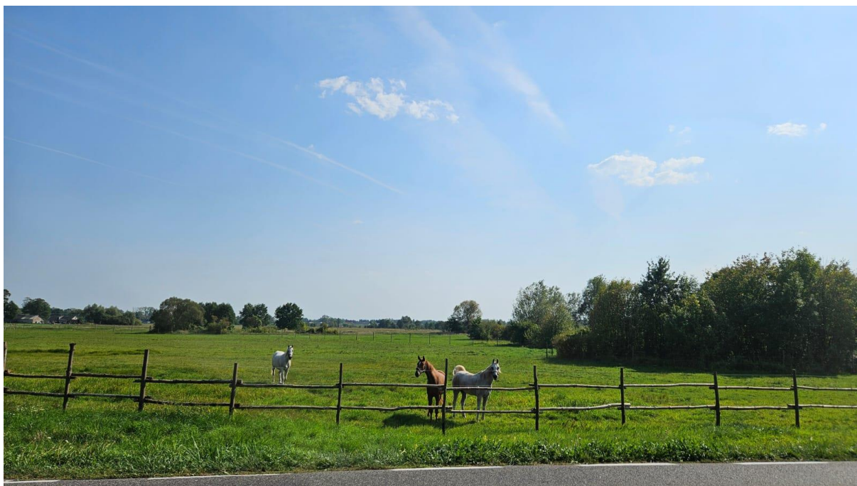
Mazowsze, wrzesień 2024 r.