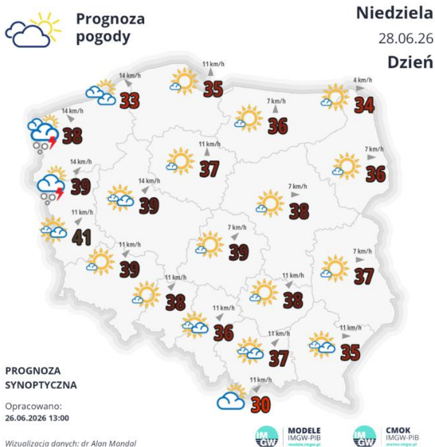
Rys. 1. IMGW_0628 Synoptyczna prognoza pogody na weekend 26-28.06.2026