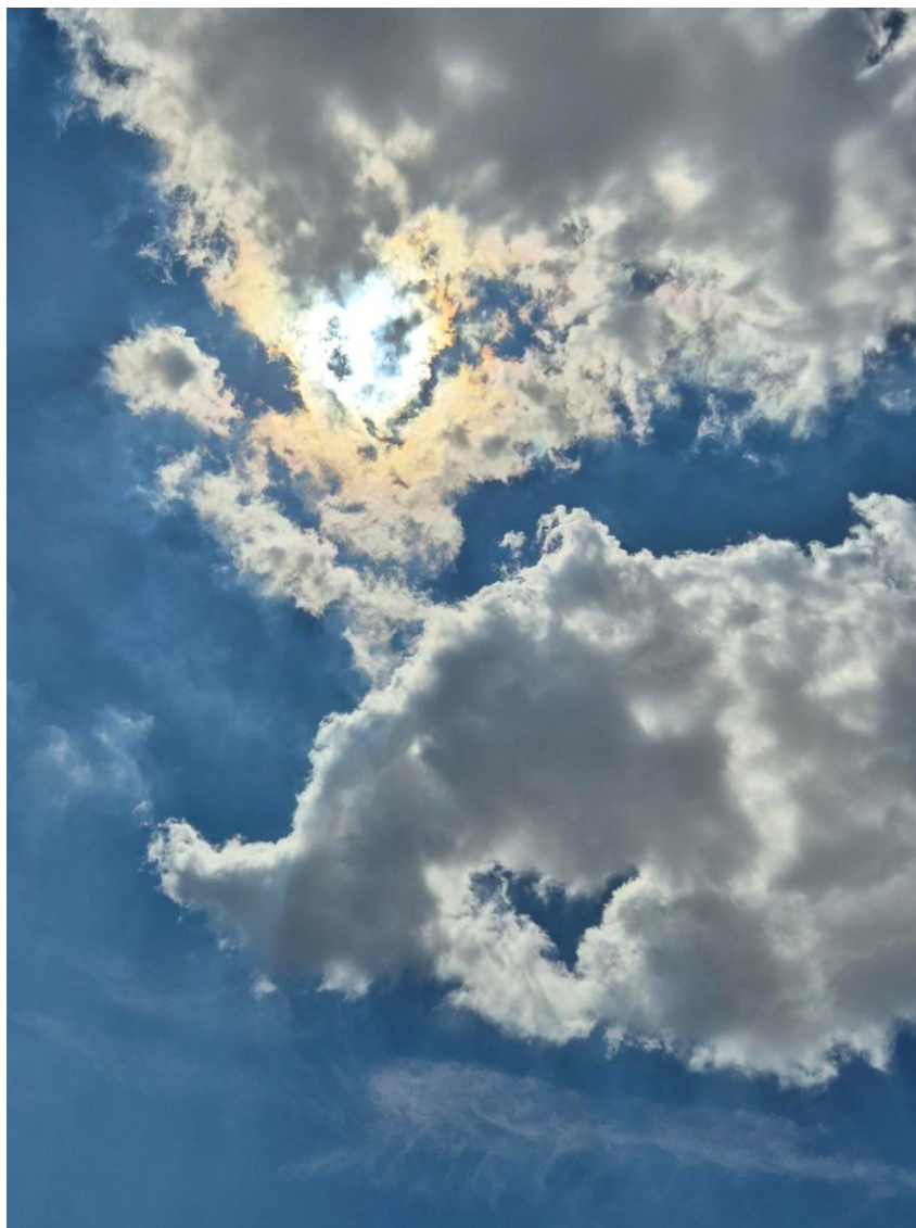
Rys.2. IMGW_0629 Prognoza synoptyczna na kolejny tydzień 29.06 - 05.07.2026

W niedzielę zachmurzenie umiarkowane i duże z przelotnymi opadami deszczu. Temperatura maksymalna od 17°C do 22°C. Wiatr umiarkowany i dość silny, w porywach do 60 km/h, północno-zachodni.