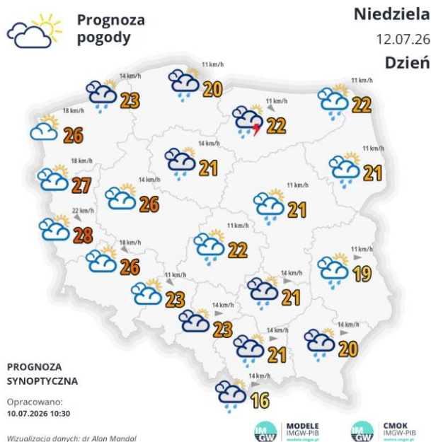
Rys.2 Synoptyczna prognoza pogody na weekend 10-12.07.2026