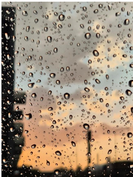
Rys.2 Synoptyczna prognoza pogody na weekend 10-12.07.2026

Zapraszamy do kontaktu z Wydziałem Komunikacji IMGW-PIB od poniedziałku do piątku w godzinach 7:00–17:00 IMGW-PIB Biuro Prasowe