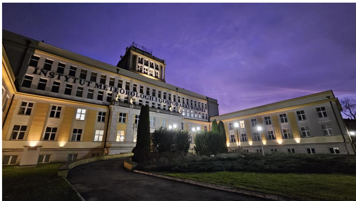
Instytut Meteorologii i Gospodarki Wodnej w Warszawie, grudzień 2024 r.