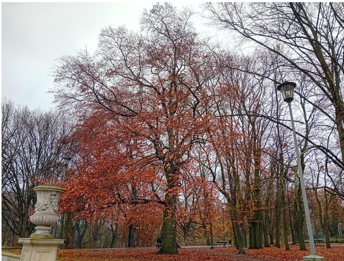
Warszawa, 04.12.2024 r.