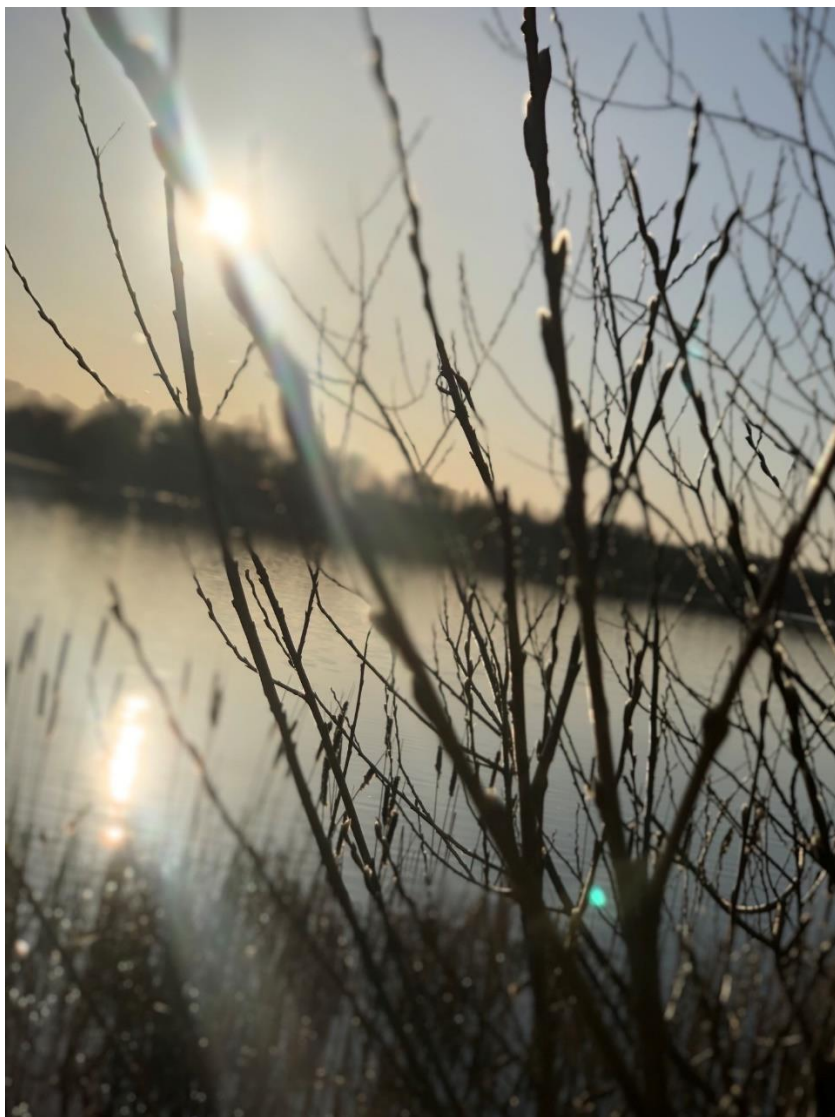
Wiosenny spacer, okolice Łeby, 31.03.2021 r.