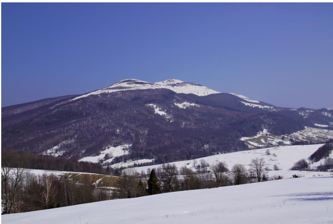
Połonina Caryńska, 27.03.2021 r.