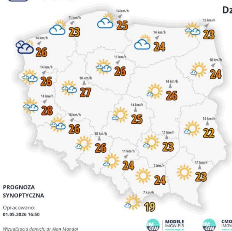
Rys.1. IMGW0501_Synoptyczna prognoza pogody na weekend 01-03.05.2026