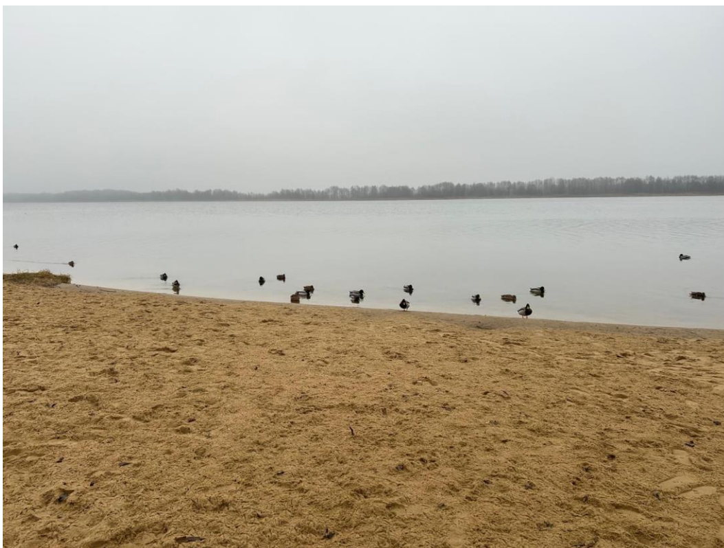
Zima nad wodą, Serock (woj. mazowieckie), 28.12.2024 r.