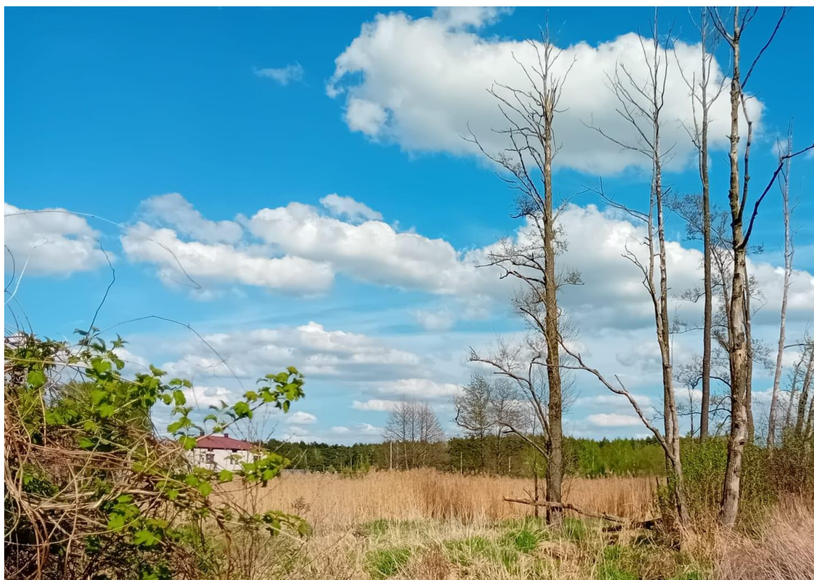
Mazowsze, kwiecień 2025 r.

W minionym tygodniu odnotowaliśmy prawdziwie letni incydent w kwietniowej przeplatance pogodowej – w czwartek i piątek w zwrotnikowej masie powietrza temperatura powietrza dochodziła do 30°C, zakończył się on jednak bardzo dynamicznie – burzami, podtopieniami i silnymi porywami wiatru. Święta minęły w nieco chłodniejszej, mniej dynamicznej, prawdziwie wiosennej pogodzie. Najbliższy tydzień będzie zdecydowanie spokojniejszy, zwłaszcza jego zakończenie. W pierwszej połowie tygodnia spodziewać się należy burz, którym towarzyszyć będą ulewne deszcze, a także silne porywy wiatru. Z każdym dniem jednak coraz chłodniej.