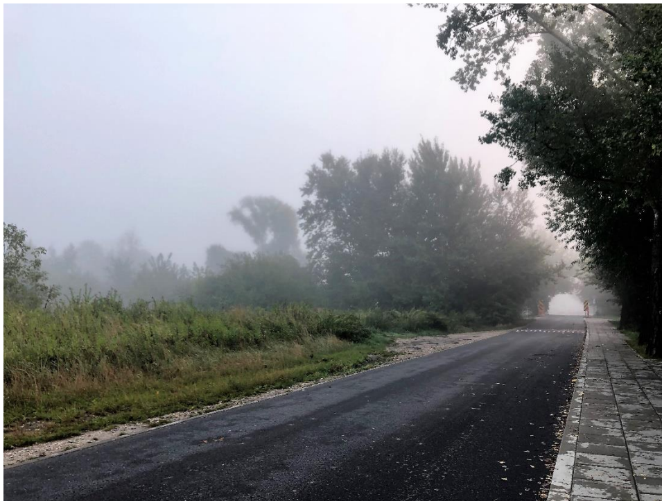
Poranna mgła.

Sobota (31 października): Uwaga na mgły, które utworzą się w nocy z piątku na sobotę. Nad ranem lokalnie na wschodzie i północnym wschodzie temperatura obniży się do 0°C i wystąpią niewielkie przygruntowe przymrozki. Na zachodzie i południu zachmurzenie będzie duże ze słabymi opadami deszczu, który stopniowo będzie zanikał. Na pozostałym obszarze sucho i pogodnie. Temperatura od 9°C na wschodzie, przez 12°C w centrum, do 15°C na zachodzie. Wiatr będzie słaby, zmienny.