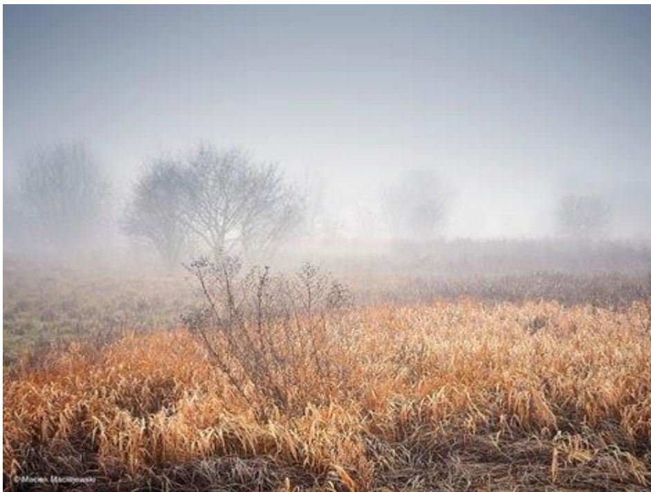
Mgły na Podlasiu