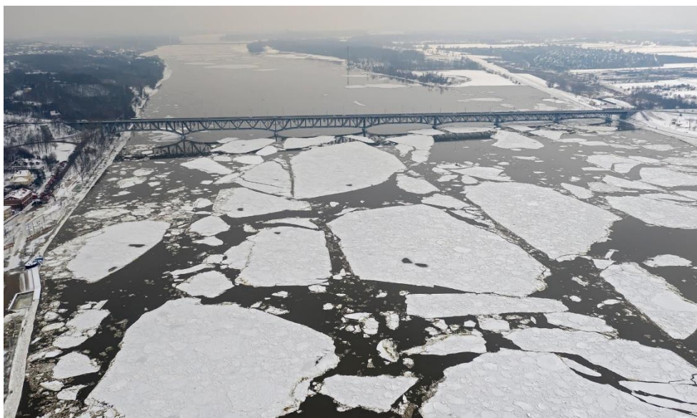
Wisła na wysokości Płocka 10.02.2021 r.