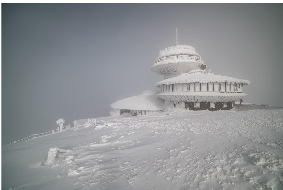
Wysokogórskie Obserwatorium Meteorologiczne na Śnieżce 9.02.2021 r.

Cieplejsze walentynki? Tak, na zachodzie i północy, ale będzie wiać. Weekend pod znakiem zmiennej pogody. Mroźna noc piątek/sobota na wschodzie i południu Polski. W nocy sobota/niedziela silniejszy mróz tylko na pogórzach. Sobota rano nad Zatoką Gdańską deszcz ze śniegiem. Potem do końca weekendu miejscowe opady śniegu (słabe do umiarkowanych), ale też sporo rozpogodzeń. Cały czas umiarkowany i porywisty wiatr – miejscami zawieje i zamiecie.