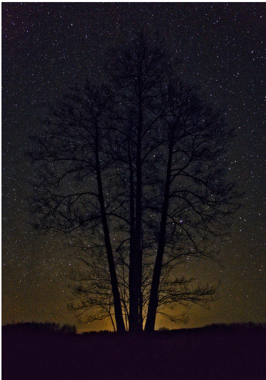
Wiosenna noc 2021.

podgórskich od 1°C do 3°C, wysoko w Beskidach od -2°C do 0°C, na szczytach Tatr około -4°C. Wiatr słaby, zachodni. Wysoko w górach wiatr umiarkowany, z kierunków wschodnich. Kraków 7°C Kielce 6°C Rzeszów 7°C Zakopane 2°C