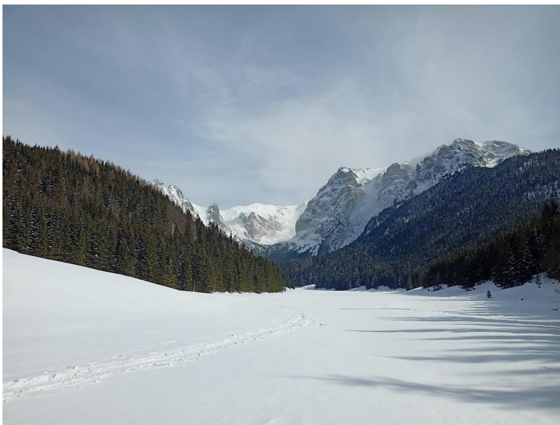
Kwiecień 2021 r. na Podhalu i w Tatrach.

Stopniowo będzie się ocieplać, przy czym najcieplej będzie na północy, najchłodniej na południu. Dominować będzie pogoda pochmurna, ale w kolejnych dniach wzrastać będzie szansa na przejaśnienia – szczególnie na północy. Do końca weekendu będzie sporo opadów. Jeszcze w piątek w rejonach podgórskich Karpat będą to opady śniegu, dość obfite, bo przyrost pokrywy śnieżnej wyniesie nawet do 15 cm. Na pozostałym obszarze opady deszczu. W kolejnych dniach – szczególnie na północy będzie się przejaśniać, a opady będą głównie przelotne. Niewykluczone burze z chwilowym intensywnym opadem deszczu.