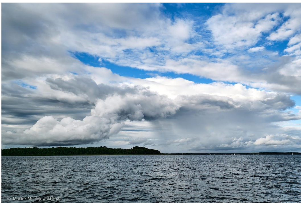
Rejs po mazurskich jeziorach.

Od zachodu Polska zaczyna dostawać się w zasięg zatoki związanej z niżem znad Wysp Brytyjskich oraz towarzyszących jej frontów atmosferycznych. Chłodne i suche powietrze pochodzenia arktycznego, które zalega jeszcze na wschodzie naszego kraju, stopniowo zostanie zastąpione przez cieplejszą i zdecydowanie wilgotniejszą masę powietrza polarnego morskiego. Przyniesie ona sporo chmur oraz opady deszczu, miejscami bardzo intensywne.