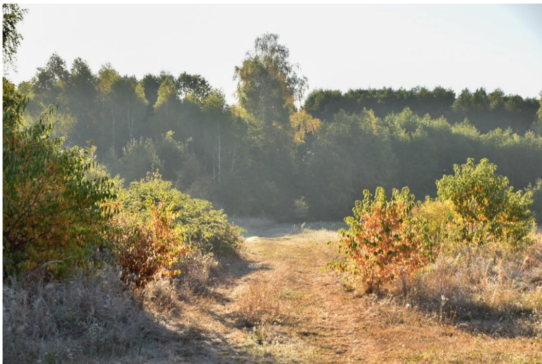
Zimny poranek na Mazowszu, wrzesień 2022 r.

Weekend pochmurny i deszczowy, z temperaturą od 21-23°C na północy do 13-15°C na południu.