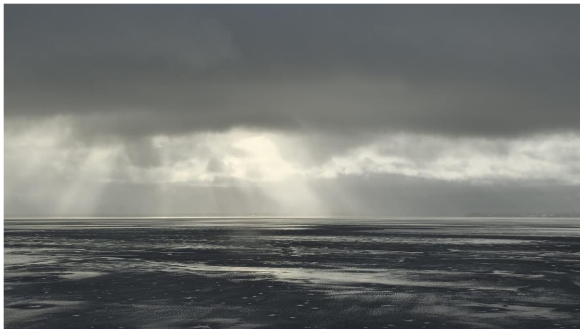
Zatoka Pucka, 20.01.2024 r.

Ten tydzień przyniesie dużo zmienności w pogodzie. Nad Polskę zaczną napływać cieplejsze masy powietrza przynoszące roztopy, przemieszczać się będą układy frontów atmosferycznych i związane z nimi opady mieszane, wiał też będzie też dość silny i porywisty wiatr. Pod koniec tygodnia znów może zrobić się nieco chłodniej, nocami wróci mróz i na ogół padać będzie śnieg.