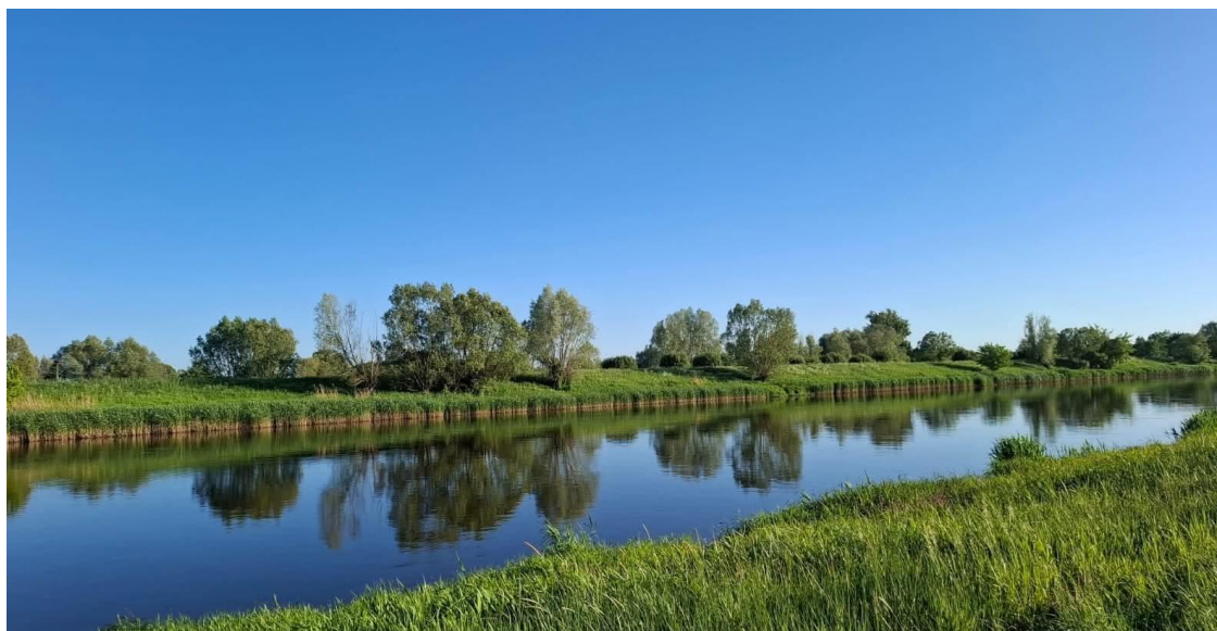
Rys.3. IMGW_0529 Synoptyczna prognoza pogody na weekend 29-31.05.2026