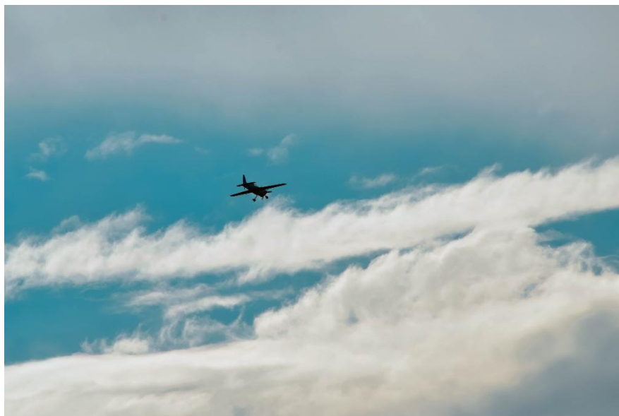
Rys.3. IMGW_0612 Synoptyczna prognoza pogody na weekend 12-14.06.2026